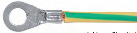
Způsob lisování KOA konektorů